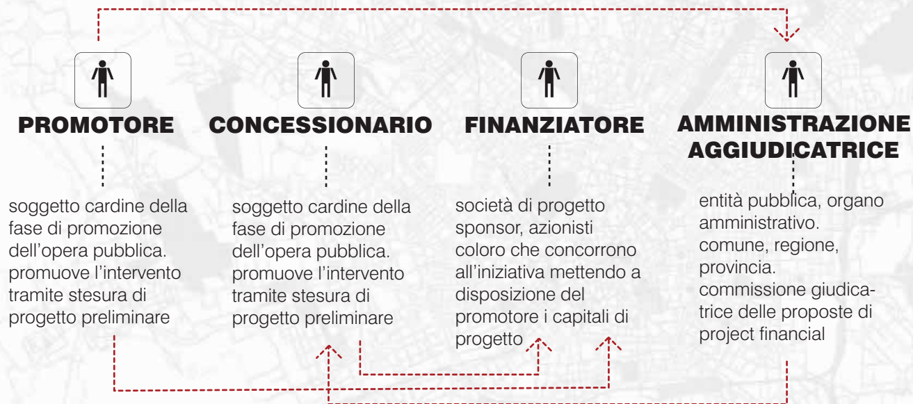
Gr.16 Componenti primarie del metodo di Project financing